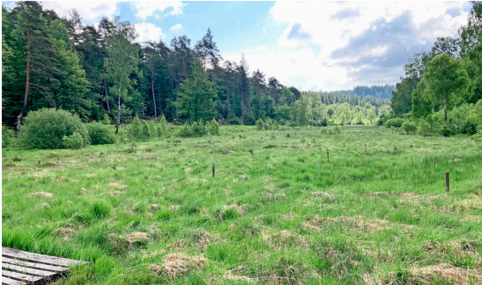
Das Wiesbüttmoor auf hessischem Gebiet (hier der obere Teil) ist weiterhin ein Pflegefall.

Auch der Einsatz von Kalkschotter im Forstwegbau ist definitiv ein erhebliches ökologisches Risiko für das Moor. Der alkalische Kalkschotter auf den Forststraßen und Forstwegen im Bereich des Moores sowie in den Rigolen-Kalkschotterbetten ist die schlimmstmögliche Variante von Material, weil er sich leicht auswäscht. Sie neutralisiert die natürliche Moorsäure und