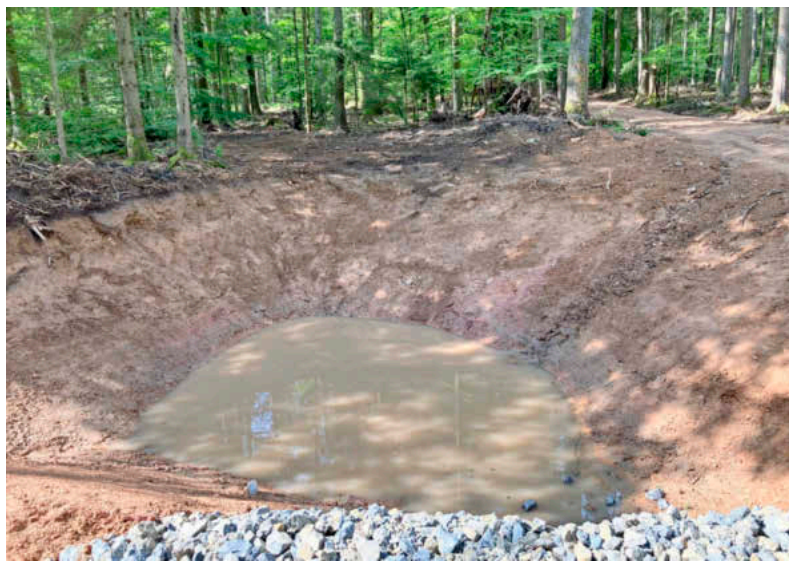
Wasser sammeln und dem Moor zuführen: Der Rigolenbau ist grundsätzlich gut, sagt Stühler. Er ist gespannt: Diese Anlagen bedürfen der regelmäßigen Wartung.